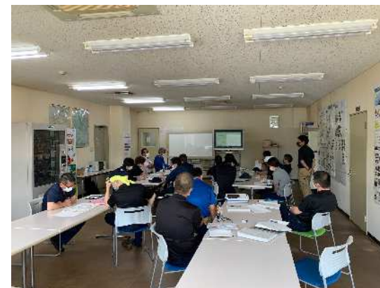
経営幹部から工程メンバーまで 参加した指導の様子