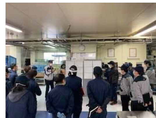
現場における支援風景