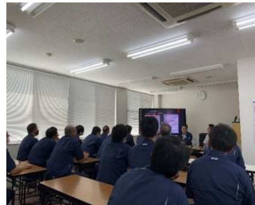
専門家を交えた従業員説明会の様子

成果：昇進・昇格等の基準を明確にし、給与水準も見直した →従業員の姿勢に変化が見られ、議論が活発に。 →管理職・評価者の意識醸成も促された。 → 外部の専門家が間に入ることで、社長と後継者の橋渡しに。