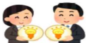
新商品の開発又は生産