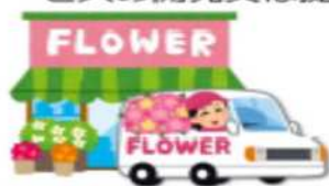
サービスの新たな提供の 方式の導入