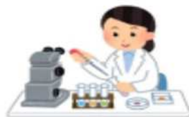
技術に関する研究開発 及びその成果の利用 ほか