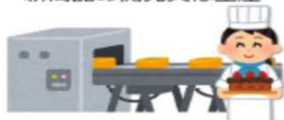
商品の新たな生産 又は販売方式の導入