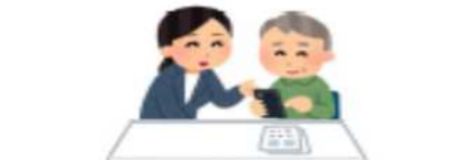
新サービスの開発又は提供