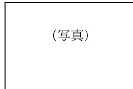
新事業製品イメージ①